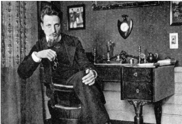
Rainer Maria Rilke

So lass uns Abschied nehmen wie zwei Sterne durch jenes Übermass von Nacht getrennt das einne Nähe ist, die sich an Ferne erprobt und an dem Fernsten sich erkennt.