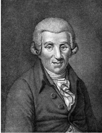
Johann Wilhelm Ludwig Gleim